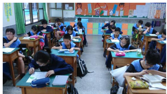
(多元智能檢核表填寫)