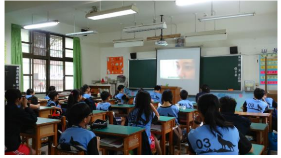
(觀賞教改十年特輯)